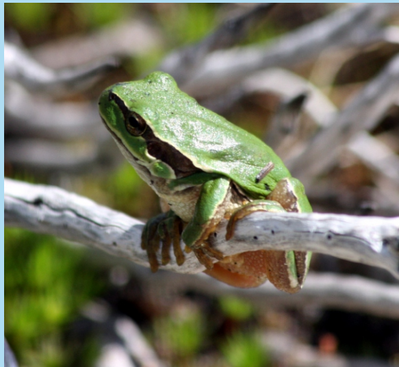
Estroza ( Hyla arborea )