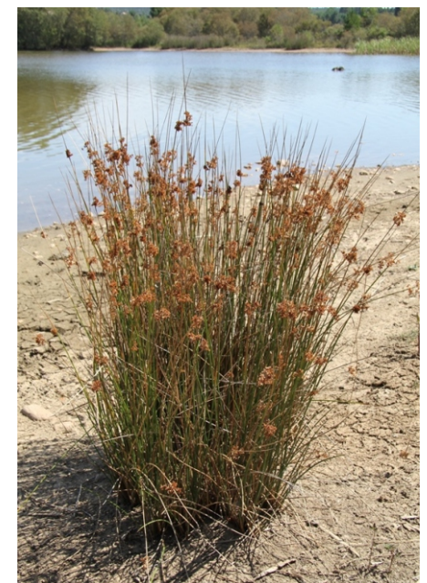
Xunco ( Juncus conglomeratus )