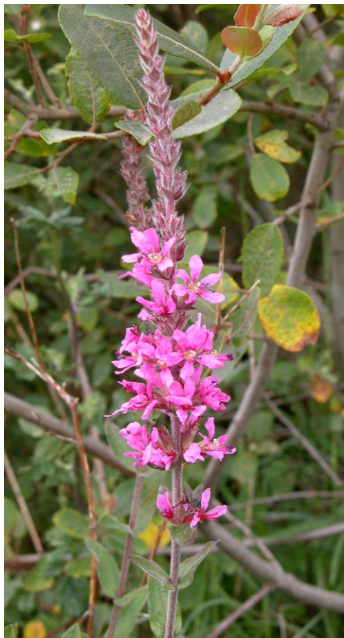
Salgueiriño ( Lythrum salicaria )