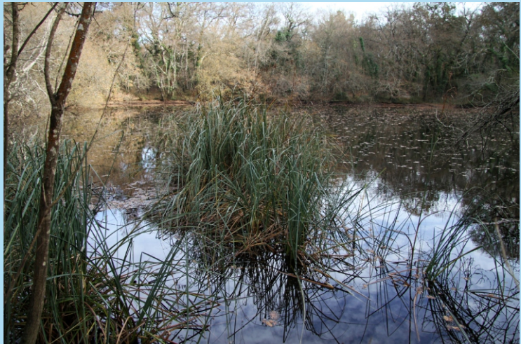
Cladium mariscus , un xunco de grande tamaño (ata 2,5 m de altura), raro en Galiza.