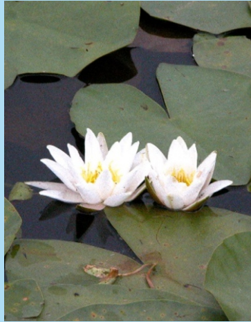
Ambroíños ( Nymphaea alba )