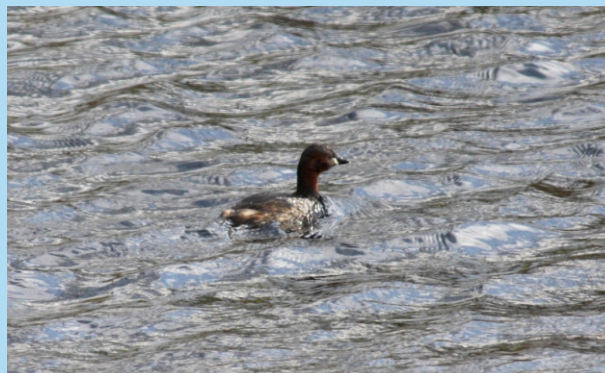
Margullón pequeno ( Tachybaptus ruficollis )