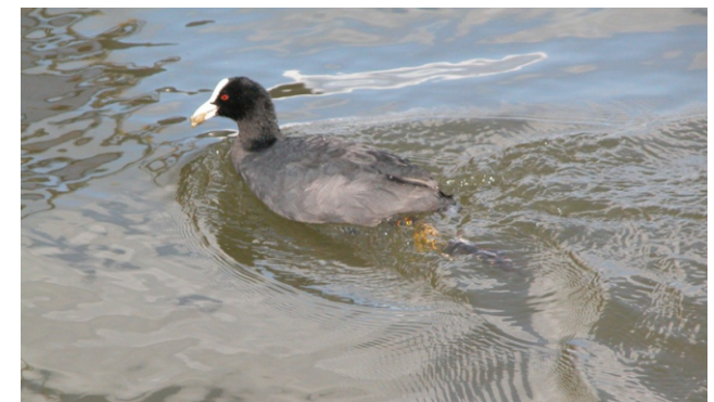
Galiñola negra ( Fulica atra )