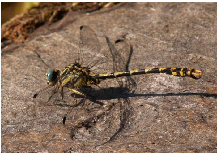
Cabalo do demo, candil tenazado ( Onychogomphus forcipatus )