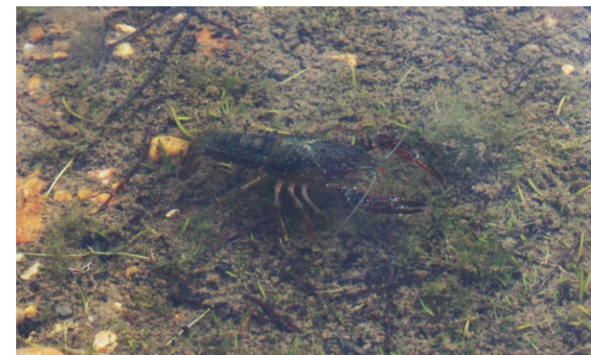
Cangrexo de río americano, unha especie invasora nalgúns ríos e humidaís da Terra Cha.